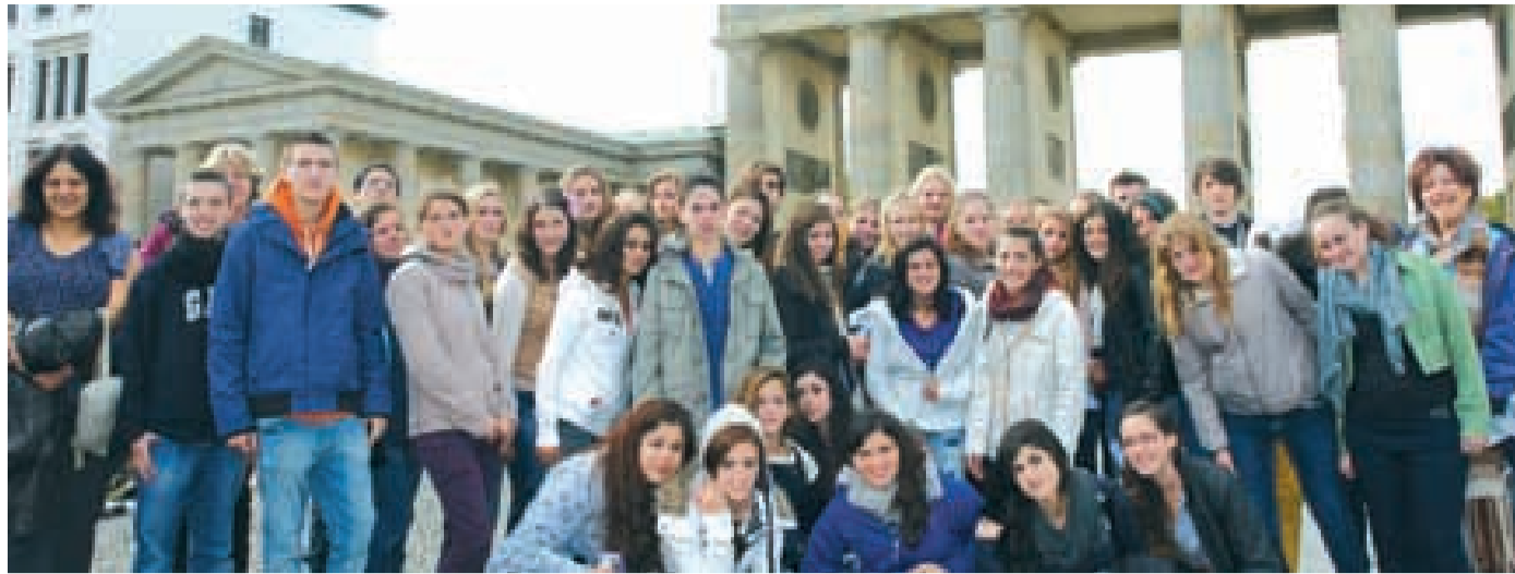
Vor dem Brandenburger Tor entstand dieses fröhliche Bild der israelisch-deutschen Schülergruppe.

Die nächste Ausstellung der Sendenhorster Kaninchenzüchter ist am 20. November bei der Kreisschau in Freckenhorst und dann erst wieder im neuen Jahr auf der Landesschau in Hamm. •as