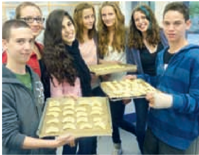
Auch israelisch Kochen und Backen stand für die Austauschteilnehmer auf dem Programm.

Mit Beginn der Herbstferien starteten die Teilnehmer des Austauschs dann zu einer dreitägigen Fahrt nach Potsdam und Berlin. Der erste Tag in Potsdam setzte die Arbeit am Film „Der Pianist“ fort. Dieser berühmte Film von Roman Polanski erzählt die Erlebnisse eines jüdischen Pianisten, der den Überfall Hitler-Deutschlands auf Po-