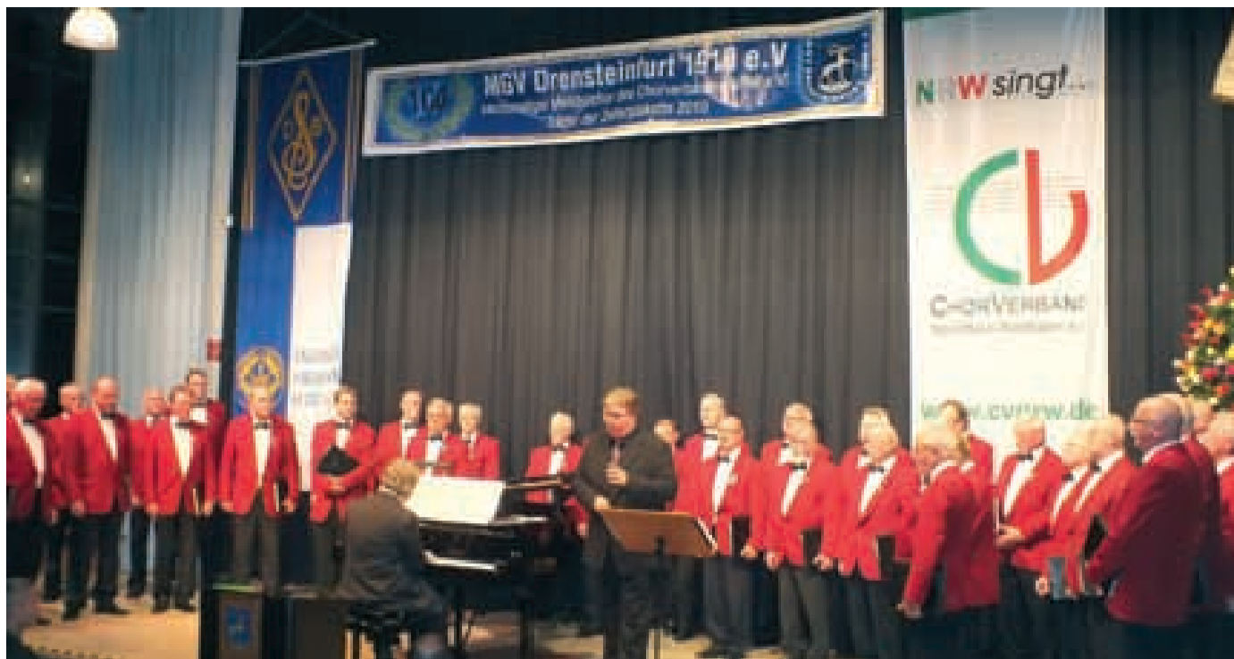
Rund 300 Zuhörer verfolgten am Sonntagabend das Herbstkonzert des MGV Drensteinfurt.